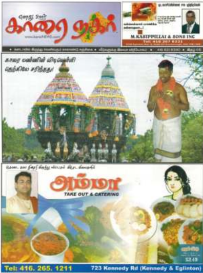
இதழ் 5 - 2009

'எனது உள் காரைநகர்' கனடாவில் இருந்து வெளியாகும் காரைநகர் மக்களிற்கான செய்தி சஞ்சிகை. 2007ம் ஆண்டு முதல் வெளிவர ஆரம்பித்து இன்று உங்கள் கைகளில் தவழும் இந்த இதழ் 25வது இதழ் ஆகும். இணையத்தளம், இன்ரநெற் வசதிகள் குறைவாக இருந்த காலத்தில் கனடாவில் 1500 பிரதிகள் அச்சடிக்கப்பட்டு 500 பிரதிகளிற்கு மேல் கனடாவில் வதியும் காரைநகர் மக்களிற்கு அஞ்சல் மூலம் விநியோகிக்கப்பட்டு வந்தது. தற்போது இன்ரநெற்றும் இணையத்தளமும் கைக்குள் அடங்கியதன் பின்னர் கைபேசிகள் மூலம் அதிவிரைவாக காரைநகர் செய்திகளை எடுத்து வந்தாலும் அவற்றில் உள்ள உண்மைத்தன்மைகள் மற்றும் உத்தரவாதமற்ற வகையில் அவரவர் விருப்பு வெறுப்புகளிற்குட்பட்டு மக்களின் தேவைகளோ மண்ணின் வளர்ச்சியோ குறிக்கோளற்ற வகையில் உலாவந்து கொண்டிருக்கும் நிலையில் 'எனது உள் காரைநகர்' சஞ்சிகையின் தேவை இன்னமும் இருந்து கொண்டே இருக்கின்றது.