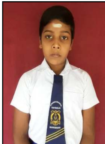
த.டர்சிகன் 167 புள்ளிகள்