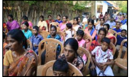
மேலும் அடுத்த பக்கத்தில்... →