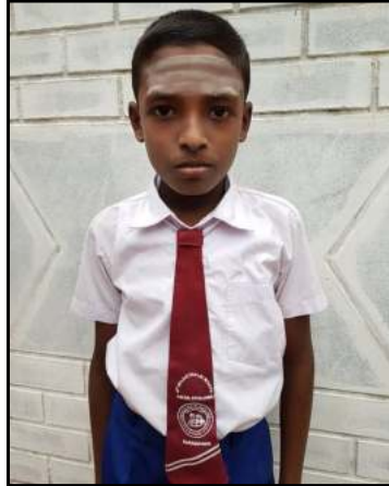
சி.டனோஜன் 172 புள்ளிகள்