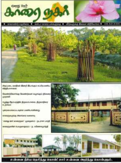
இதழ் 1 - 2007