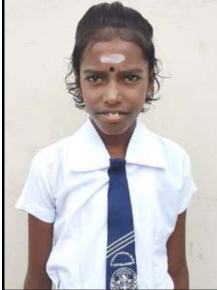
தி.தமிழரசி 162 புள்ளிகள்