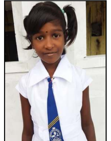
யோ.கஜானி 161 புள்ளிகள்