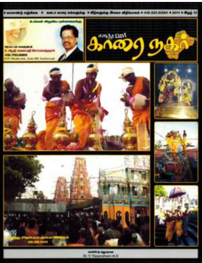
இதழ் 13 - 2011

எதிர்பார்ப்புகள் இன்றி இப்பணியில் ஆரம்பம் முதல் ஈடுபட்டு வருவதால் எதிர்ப்புகளிற்கு மத்தியிலும் பலவித முறைப்பாடுகளிற்கு மத்தியிலும் ஊர்ப்பணி தொடர்கின்றது.