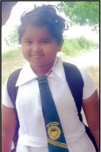
சோ.கம்சிகா 176 புள்ளிகள்