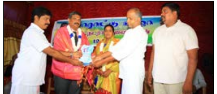
மேலும் பிரியாவிடை நிகழ்வின் புகைப்படங்கள் முன்அட்டை உள்பக்கத்தில் ...